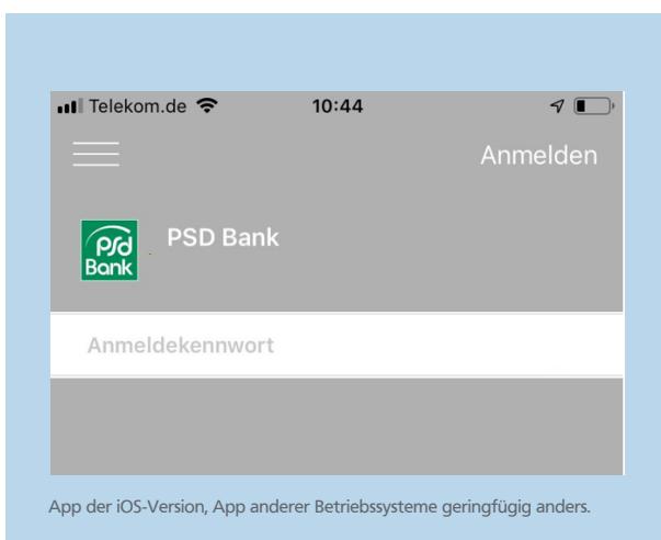
App der iOS-Version, App anderer Betriebssysteme geringfügig anders.

» Öffnen Sie die App. Melden Sie sich mit Ihrem PSD-Key und Ihrer Bankleitzahl an. Legen Sie ein Anmeldekennwort für die SecureGo-App fest. Das Kennwort benötigen Sie künftig für jede Anmeldung in der SecureGo-App.